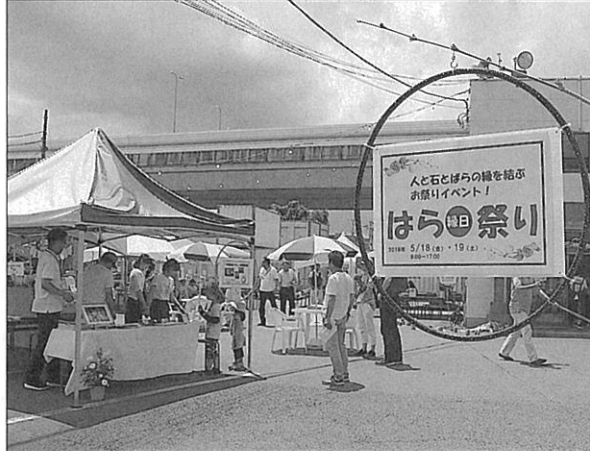
「はら祭り」会場は緑日感覚で楽しめるような設えも特徴となっている