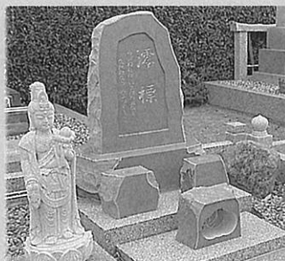
根府川の自然風墓石

「埼玉県滑川町の武藤石材様がご自身で石を調達し、加工した現物を3基展示します!独特な色合い・石肌を持つ根府川石ならではの存在感を、ぜひご確認ください!」